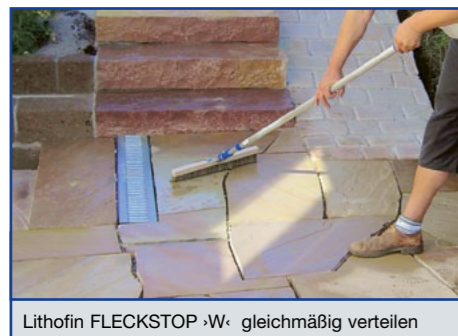
Lithofin FLECKSTOP ›W‹ gleichmäßig verteilen