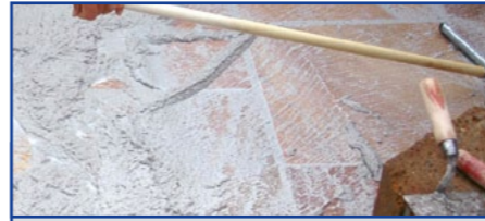
Ausfugen mit drainfähigem Epoxidharz-Fugmaterial

Flecken durch aufsteigende Feuchtigkeit können durch „Rundum-Imprägnierung“ vor dem Verlegen reduziert werden. Voraussetzung für dieses Verfahren ist, dass die Steinplatten trocken und sauber sind und in Splitt verlegt werden. Das allseitige Auftragen auf die Platte erfolgt durch Tauchen (ca. 30 Sekunden) oder Einstreichen mit einer Rolle oder einem Pinsel oder Einsprühen. Vom Material nicht aufgenommenes Produkt muss vor dem Trocknen abgewischt werden. Vor dem Verlegen oberflächlich abtrocknen lassen, da bei Verlegung im nassen Zustand ein Wirkungsverlust eintreten kann.