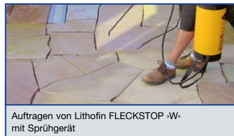
Auftragen von Lithofin FLECKSTOP ›W‹ mit Sprühgerät